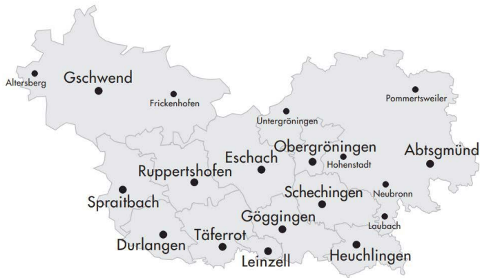
Abbildung: Region Schwäbischer Wald

Die Region Schwäbischer Wald im Ostalbkreis wurde aufgrund der dortigen hausärztlichen Interversorgung für das Projekt ausgewählt. Koordiniert wird das Projekt vom Landratsamt des Ostalbkreises.